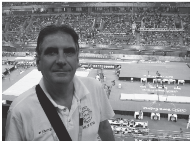
A Marosvásárhelyi Rádió közismert román sportkommentátora a 2008-as pekingi olimpián

A könyvet tegnap délelőtt mutatták be a Maros Megyei Könyvtárban.