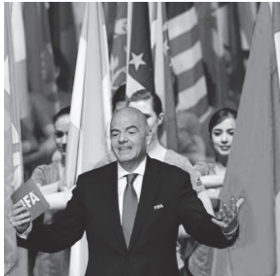
A FIFA elnöke, Gianni Infantino erőteljesen szorgalmazta a labdarúgó-világbajnokság mezőnyének bővítését – elérte célját

* Minden eddigénél több csapat vehet részt a labdarúgó-világbajnokságon: a Nemzetközi Labdarúgó-szövetség (FIFA) zürichi kongresszusán úgy határozott, hogy 2026-tól kezdve a mostani 32 helyett 48-as mértékben rendezik meg a földkerekség legjobbainak tornáját. A döntés egyhangúlag született. A vb-tornára kijutó csapatokat 16 csoportba sorolják, közülük egyformán egy esik ki, az első kettő továbbjut az egyes kieséses szakaszba. Ebben a rendszerben a jelenlegi 64 helyett 80 mérkőzést rendeznek majd, míg a világbajnokság 32 napossá válik. A 2026-os vb házigazdáját 2020 májusában jelölik ki.